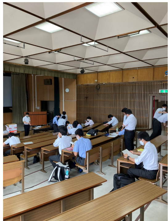
実力診断テスト実施前の学習の様子

進路に関わる重要な試験を受験し、試験の手応えを感じるだけでなく、より一層進路について考える一日になりました。