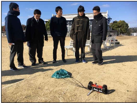
パラシュートは切断できるか...