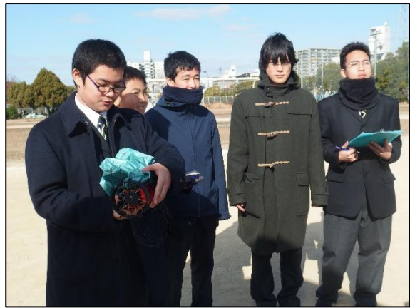
新たな課題が発生しました。

大阪府立大学のSSSRC（小型宇宙機システム研究センター）の皆様には、当日の寒い中、朝早くから準備していただき誠に有難うございました。