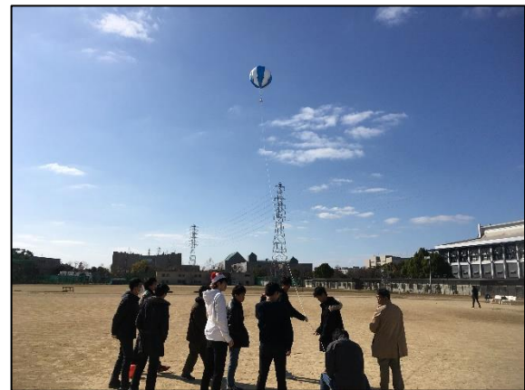
アドバルーン上昇