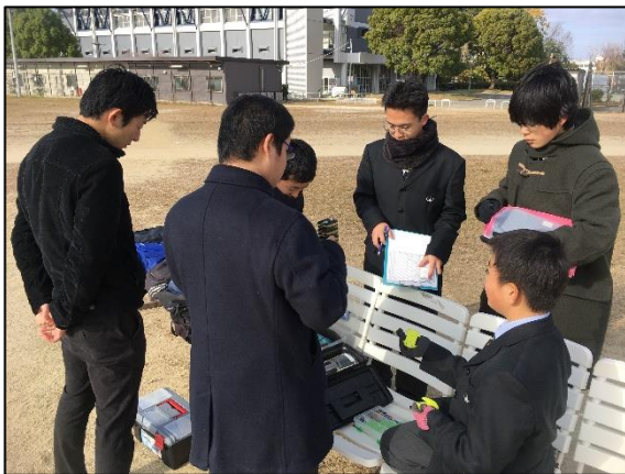
ローバーサット組み立て中