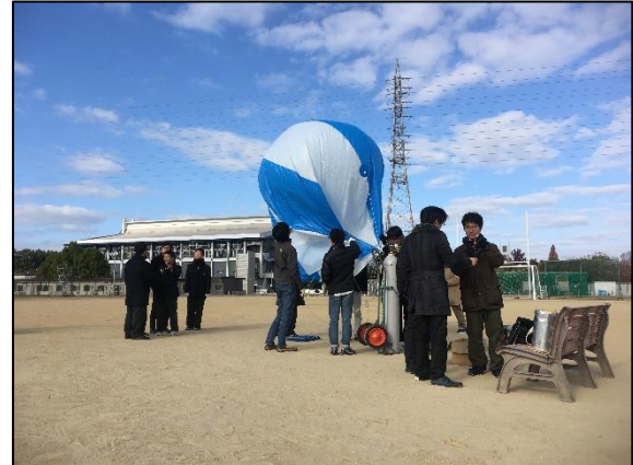
アドバルーン準備中