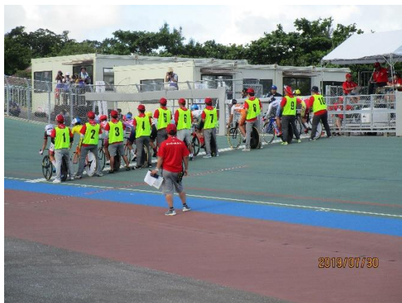
予選スタート風景