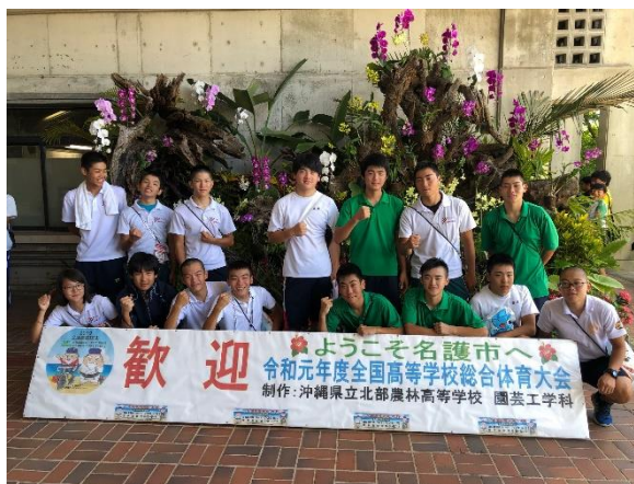
大阪府選手団で記念撮影(7月29日開会式)