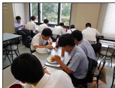
学生食堂で昼食中