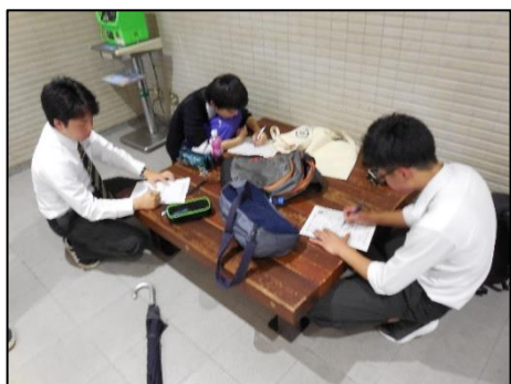
アンケート記入中