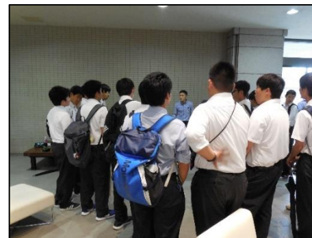
最後に集合・解散