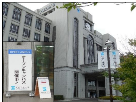
9:30 に大阪工業大学 正門に集合

2019年7月14日（日）大阪工業大学（枚方）オープンキャンパスに大学連携授業の一環として参加しました。