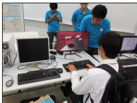
プログラムの学習中