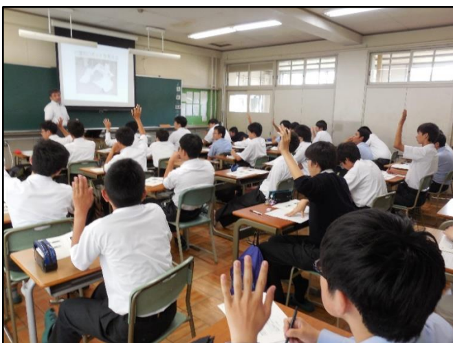
積極的に参加しました

ヒューマンインターフェイスについて講義を受けました。 産業用ロボットでは無く、身近なロボット(個々に対応した ロボット)の取り組みの研究について説明を受けました