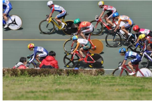
スクラッチ予選4組 15番キャップ