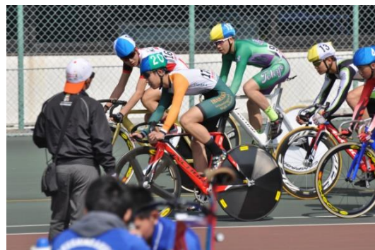
ポイントレース予選2組 20番キャップ