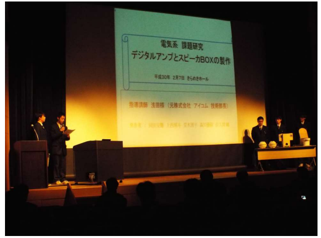
電気系 デジタルアンプ・スピーカーBOXの製作