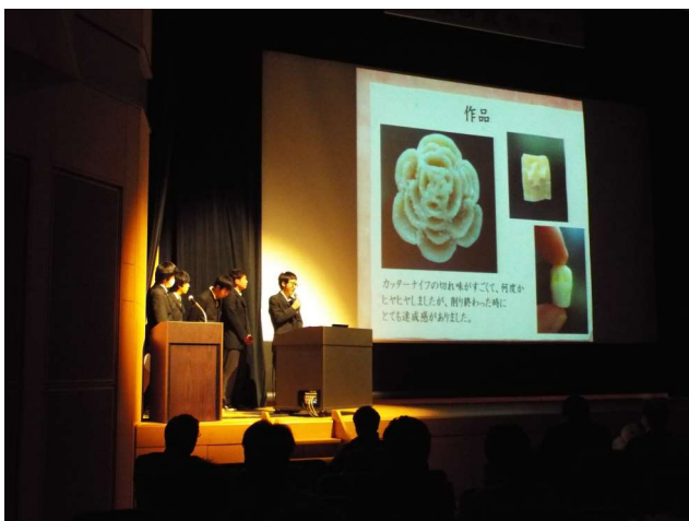
環境化学システム系 透明石けんの製作