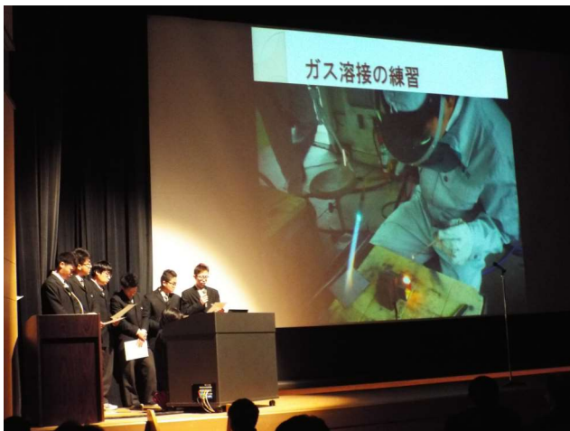
機械系 看板の製作

実施に際し、他の工科高校の先生や保護者の方には、ご参加頂きありがとうございました。 発表風景を掲載いたします。