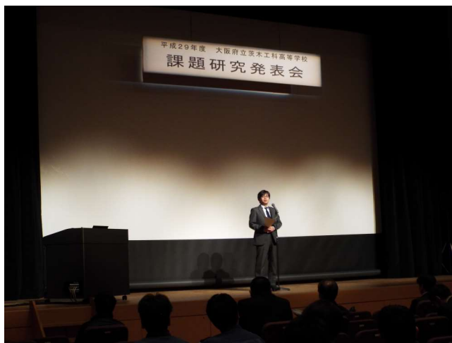
大阪府教育庁 指導主事 講評