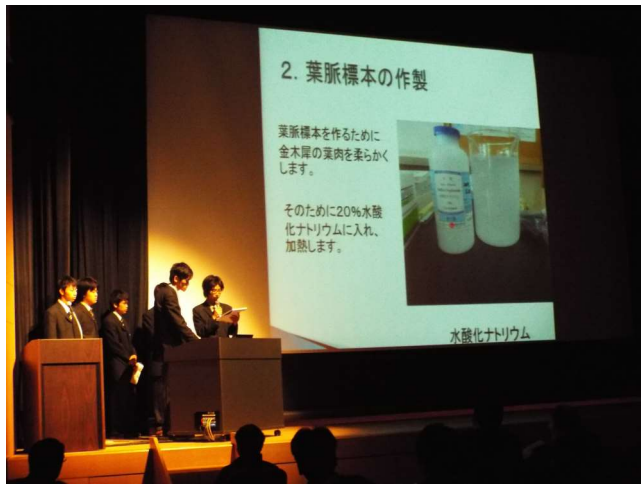
環境化学システム系 葉脈標本メッキ