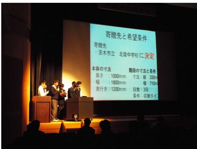
機械系 アルミ朝礼台の製作