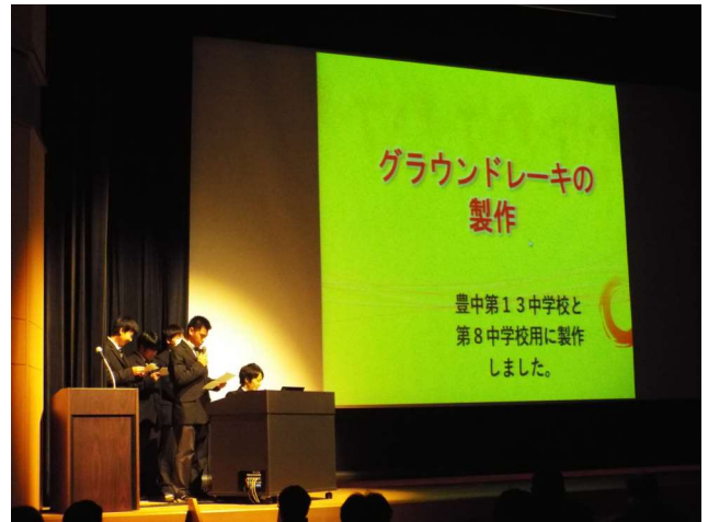
機械系 グラントレーキの製作